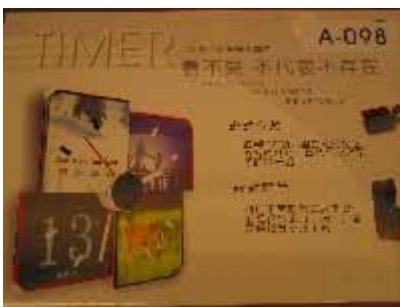
A-098 大葉大學 林儀杰