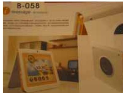
B-058 台灣科技大學 王克民