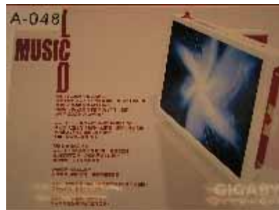
A-048 台灣科技大學 廖軍豪