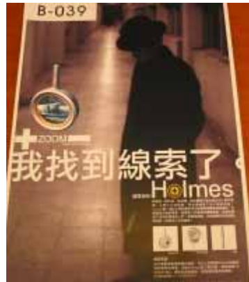
B-039 台灣科技大學 王啓翰