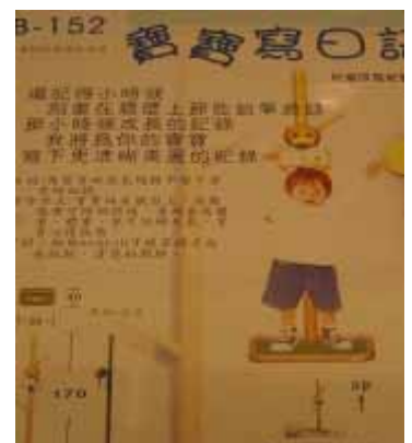
B-152 大葉大學 林智文