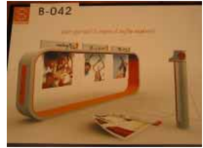
B-042 台灣科技大學 吳協衡