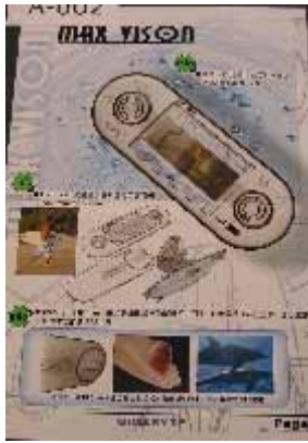
A-002 台灣科技大學 廖瑞堂