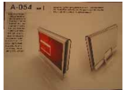
A-054 台灣科技大學 王翊軒