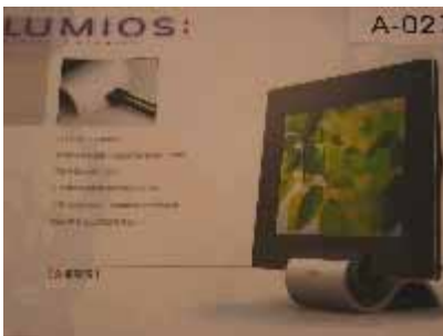
A-027 台灣科技大學 林開祥