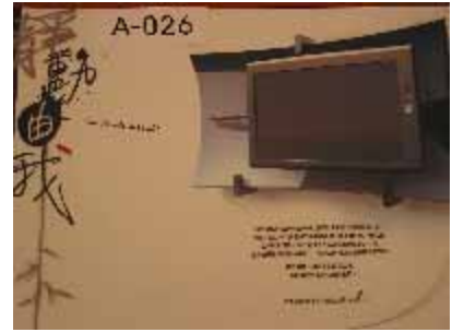
A-026 台灣科技大學 高茂豐