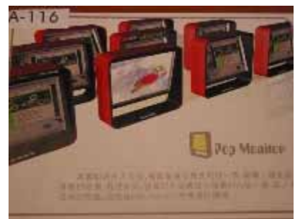
A-116 成功大學 游聲堯