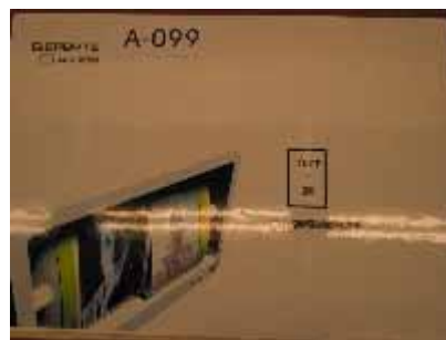
A-099 大葉大學 張哲維