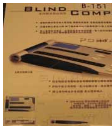
B-151 大葉大學 許哲嘉