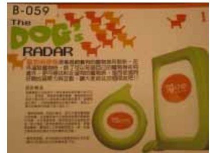
B-059 台灣科技大學 陳呂維