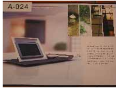
A-024 台灣科技大學 吳岳翰