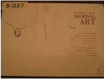
B-037 交通大學 陳逸原