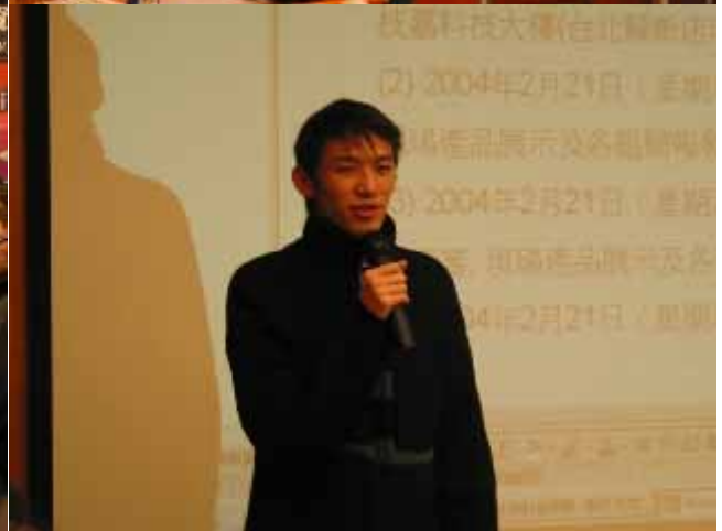
許多同學都說，今天的設計研會討論讓他們受益良多，「人因夢想而偉大，設計因