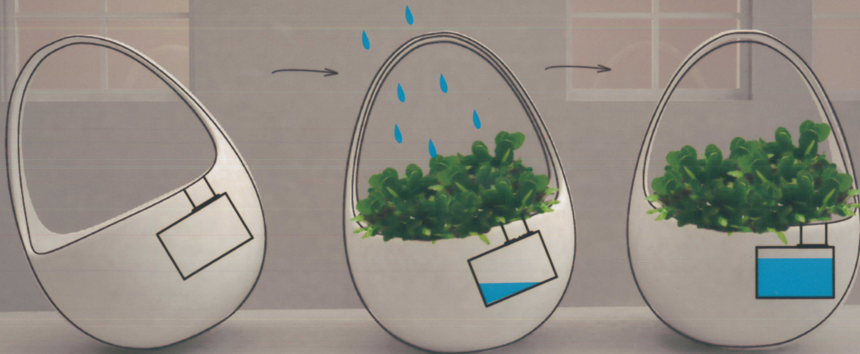
內有比重配置 當植物缺水時花盆傾向一邊

養植物時，常常因為忘記澆水而讓植物枯萎，此產品藉由趣味的方式來達到提醒孩童澆水的目的。