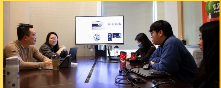
B組設計 & 專利