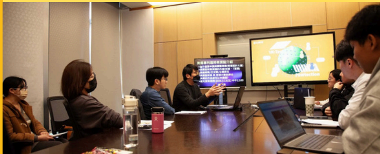
A組設計 & 專利